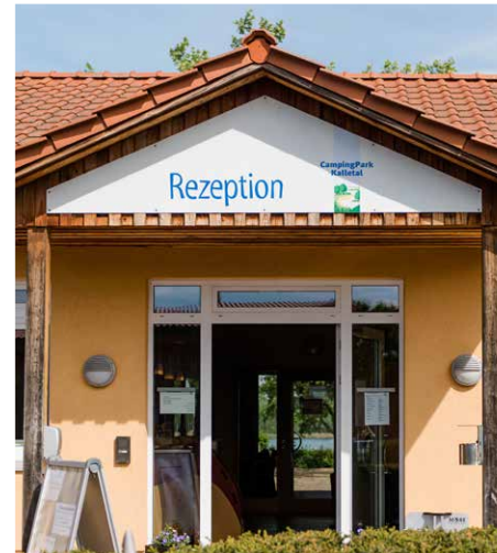
Startpunkt Campingpark Kalletal Starting Point

view of the Weser river. Once you have reached Erder, you continue close to the Weser to the East Westphalian town of Vlotho. Here you cross a bridge that takes you to the other side of the river and continue on the official section of the Weser Cycle Path to Eisbergen. From here you pass a bridge and continue your tour towards Stemmen. On the way you have nice opportunities to take a break.