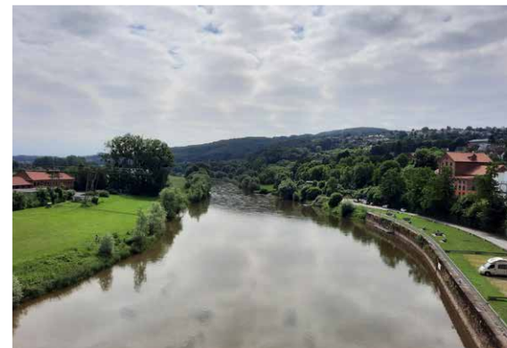
Vlotho ± 13,1 km