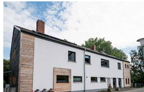
Schnapsbrennerei „Die Fähre“ ± 5,0 km