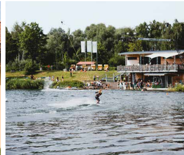
Wasserskianlage Kalletal ± 1,0 km